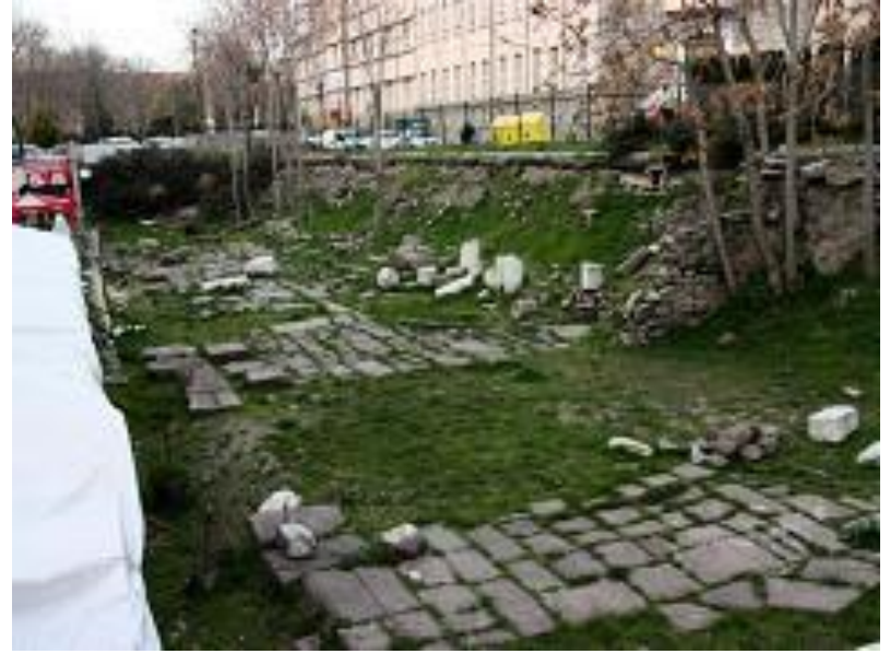
Roma Yolu, MS 2. yy