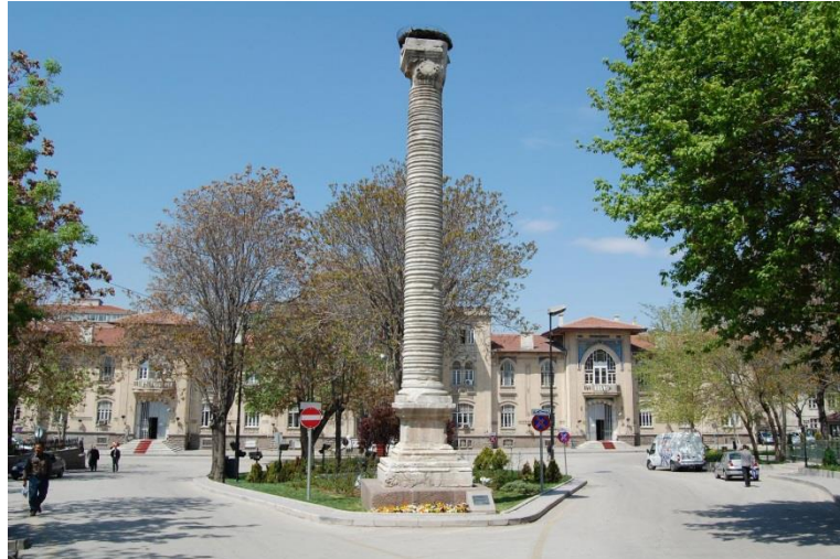
Julianus, MS 4. yy/ MS 6. yy