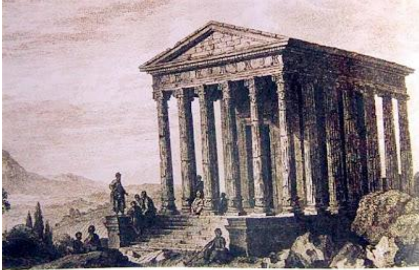
Res.16, Augustus Tapınağı gravürü (J.B. Hilair)