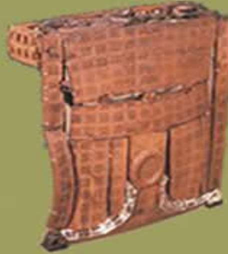
Hizmet Masası.Ahşap.Yük.94 cm.Gordion.Büyük Tümülüs.İ.Ö.8.yy.sonu.