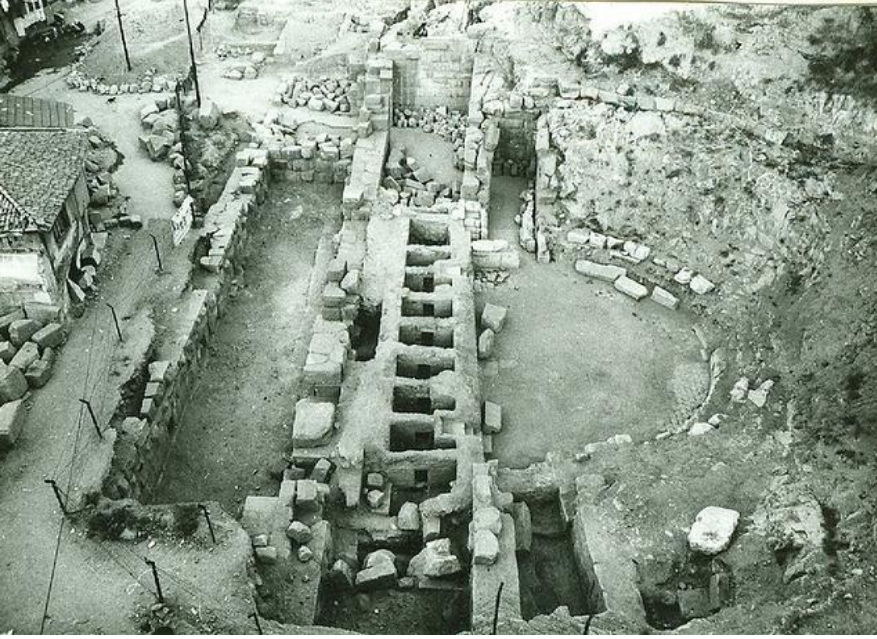
Roma Tiyatrosu, MS 2. yy