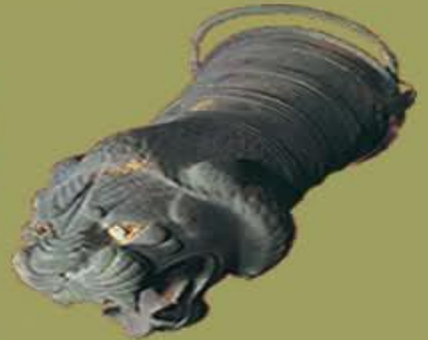
Aslan başlı situla.Tunç. Yük.22.3 cm. Gordion.B.Tümülüs. İ.Ö. 8.yy. sonu