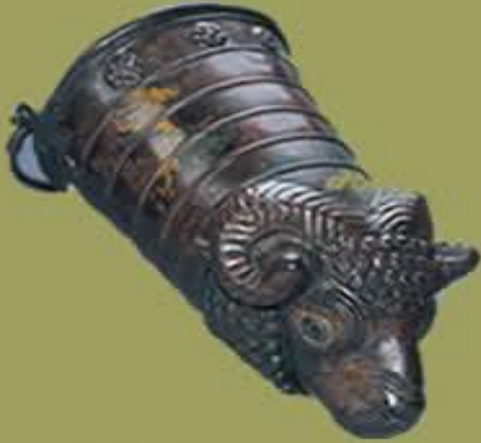
Koç başlı situla.Tunç. Yük.22 cm. Gordion.B.Tümülüs. İ.Ö. 8.yy. sonu