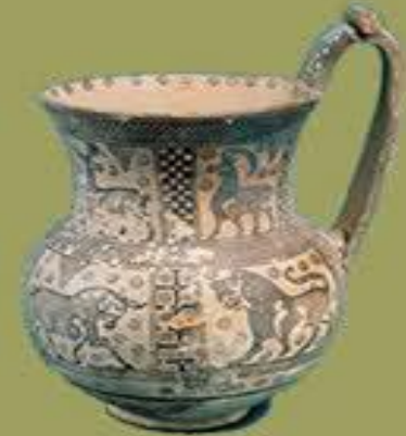
Boğa bezekli kap. Pişmiş toprak. Yük.30 cm .Gordion. İ.Ö.8.yy sonu 7.yy başı