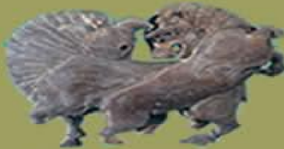
Boğa ile aslan biçimli oyuncak. Ahşap. Yük. 6,8 cm. Gordion. P.Tümülüsü. İ.Ö. 8 yy sonu -7.yy başı