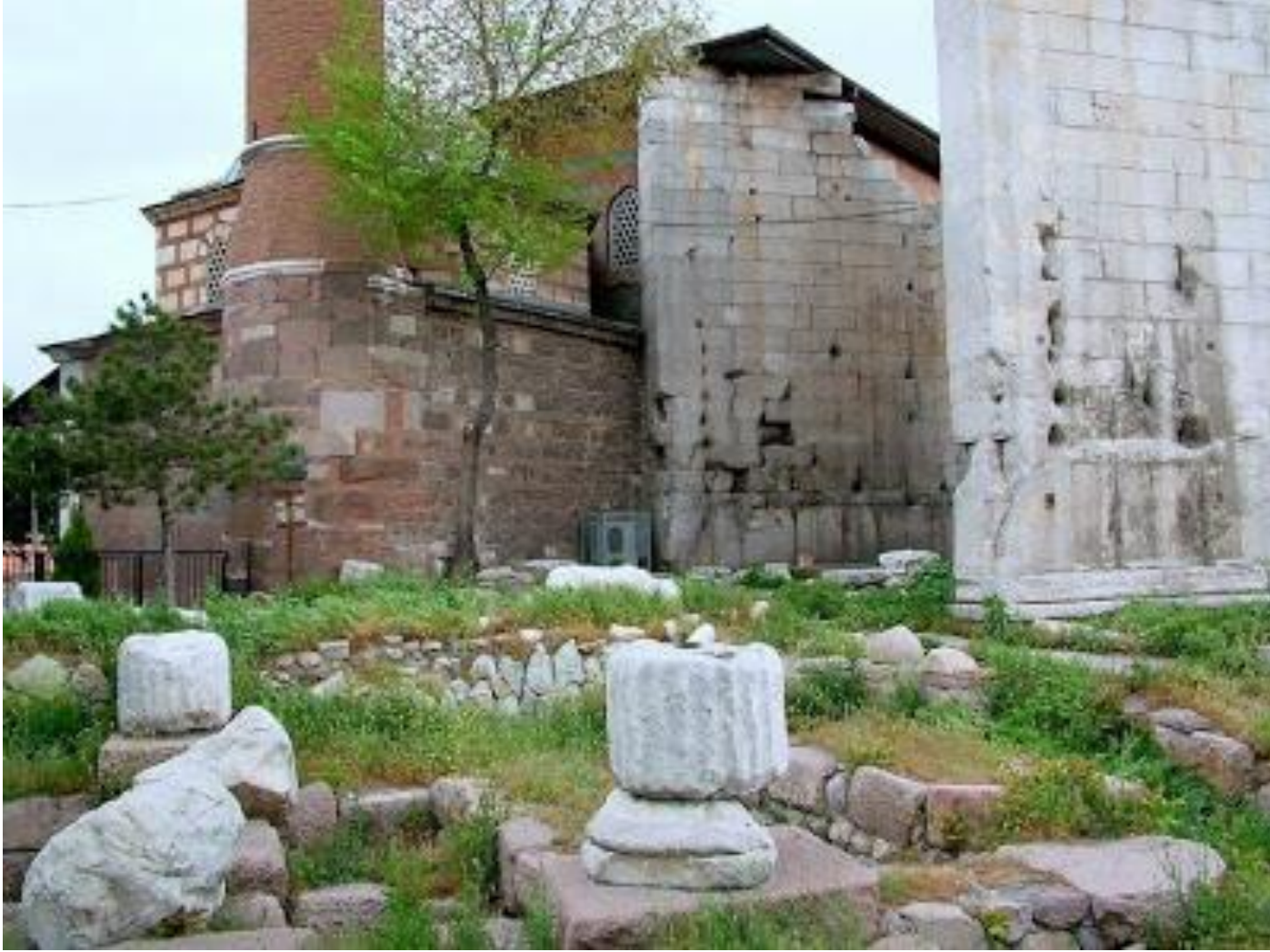
Hacı Bayram Camii ve Külliyesi, 1427-1428