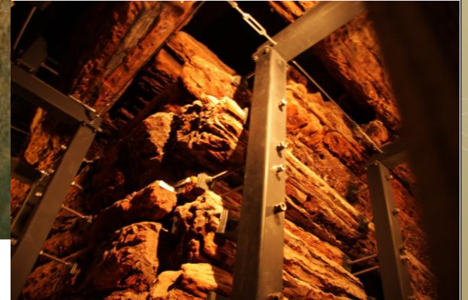
Gordion Büyük Tümülüs