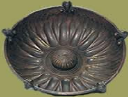
Göbekli tas.Tunç.Yük.5 cm Gordion.B.Tümülüs. İ.Ö.8.yy sonu